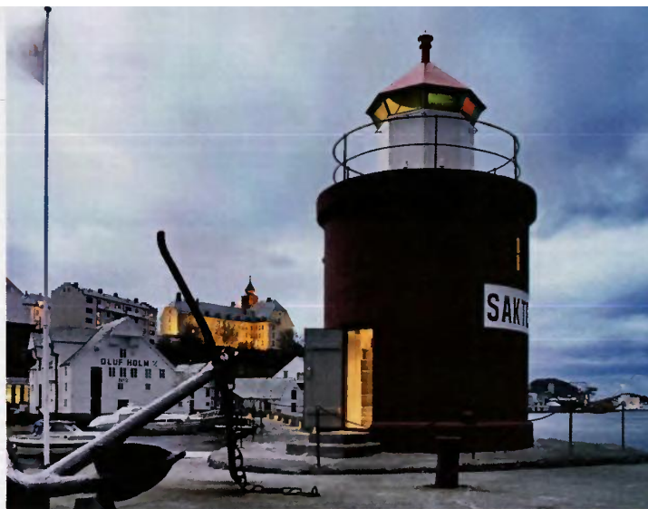
Sopra, Room 47 nel faro di Ålesund. A destra, i suoi interni, disegnati dallo studio Snohetta .